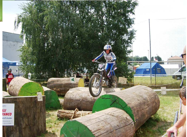
DAMEN EM LAZZATE ITALIEN EINE HITZIGE UND STAUBIGE VERANSTALTUNG UND EINS MEINER ZIELE WURDE WAHR.... III. PLATZ UND AUF DEM TREPPCHEN BEI DER DAMEN EM WOMEN INTERNATIONAL