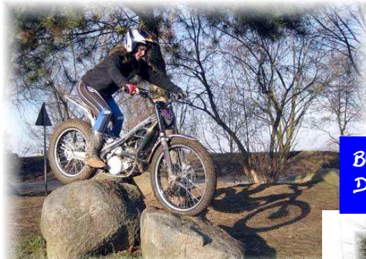
BEI DER DM IN GROBHEUBACH MIT DABEI.....