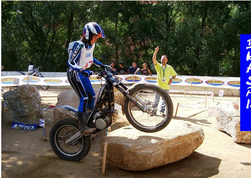
DAMEN EM RIPOLL KATALONIEN SPANIEN HOHER SCHWIERIGKEITSGRAD PLATZ VII WOMEN INTERNATIONAL