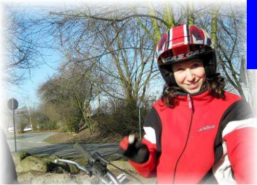
MIT ALEX TRAINIEREN IN BENSHEIM