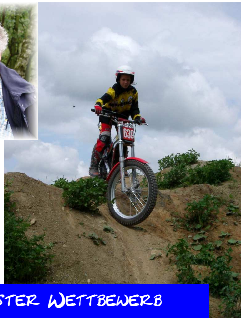
110011 MEIN ERSTER WETTBEWERB