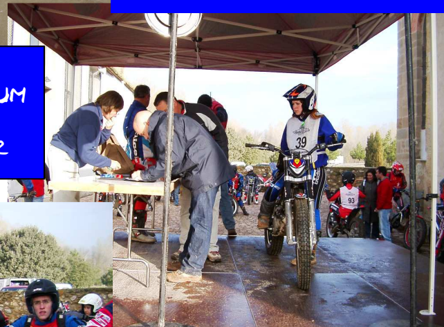
MEIN IV GEBURTSTAG, GEFEIERT AUF DER FAHRT ZUM EM LAUF IN MORELLA SPANIEN, IN LLORET DE MAR