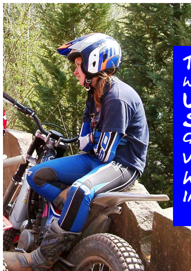
TROTZ WITTRIGER UMSTÄNDE SUPER GUT GELAUFEN VII. PLATZ WOMEN INTERNATIONAL