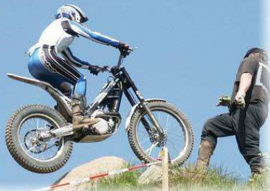
BEIM LADIES CUP KLASSE A ERFOLGREICH... WUNDERSCHÖNE LANDSCHAFTEN KENNEN GELERNT..... WO DER TRIALSPORT RICHTIG SPAS MACHT.....