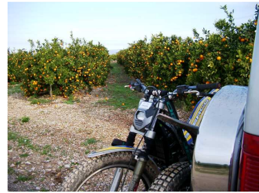
DURCH ORANGENPLANTAGEN INS TOTAL KALTE UND VERREGNETE MORELLA