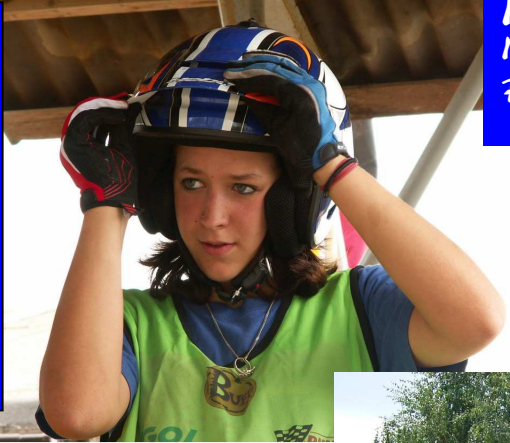
IM TRAININGSLAGER IN LA BRESSE FRANKREICH